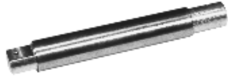
Model MBL/Model MBH

Models MBL and MBH Minigram Beam Load Cells are engineered to measure very low bending forces and still achieve an impressive 0.1% full scale non-linearity and hysteresis. Built-in overload stops are incorporated to provide additional reliability. Miniature dimensions allow easy unit integration into existing systems. Model MBL uses semiconductor gages and is available for load ranges from 25 to 1000 grams. Model MBH uses foil gages and is available for load ranges from 150 grams to 10 lbs.