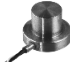
Model LFH-7I Compression Only

Model LFH-7I Subminiature Load Cell is a low profile force transducer for applications with minimal space and high capacity requirements. This transducer utilizes foil strain gages to measure compression loads of up to 10,000 lbs. and achieves non-linearity and hysteresis of +/- 0.5% full scale. The top of the load cell is the area where the force is applied and the base ring of the load cell must be placed on a hard, machine-ground flat surface to obtain optimum accuracy.